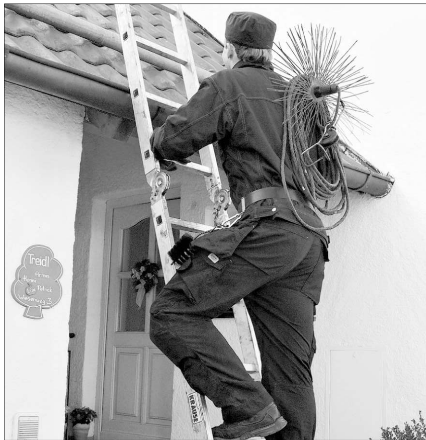
Höhenangst darf man als Kaminkehrer nicht haben.

Mindestvoraussetzung für die Ausbildung zum Kaminkehrer ist ein qualifizierender Hauptschulabschluss. „Wir sind Dienstleister, deshalb müssen wir gut mit Menschen umgehen können“, sagt Treidl. Wer sich für den Beruf des Kaminkehrers interessiert, sollte zuverlässig sowie lern- und leistungsbereit sein. Ausdauer und Belastbarkeit sind ebenso wichtig wie Sorgfalt und Gewissenhaftigkeit. Der Auszubildende sollte auch die Fähigkeit haben, eigene Ideen und Problemlösungen zu entwickeln. Da man sehr viel mit Kunden zu tun hat, sollte man laut Treidl höflich,